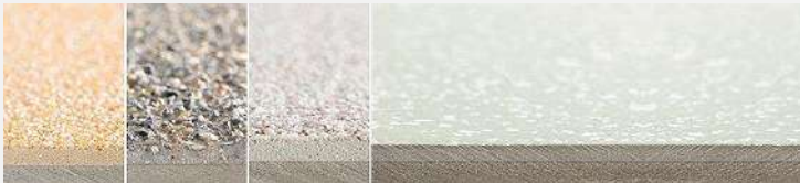
بافت سطحی کفپوش های دگادور در کاربردهای مختلف